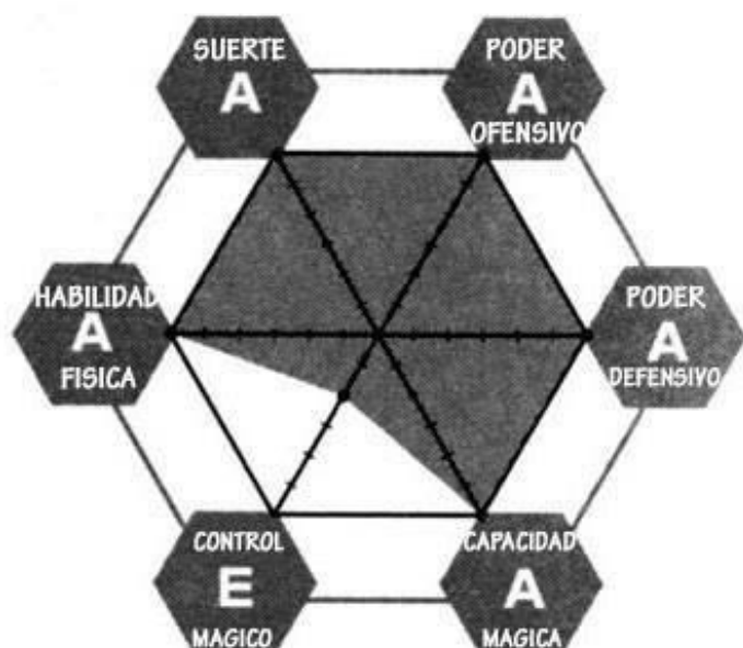
GRAFICO DE ATRIBUTOS:

RESUMEN PERSONAL: INSTRUCTORA ESPECIAL DE LA ACADEMIA HAGUN