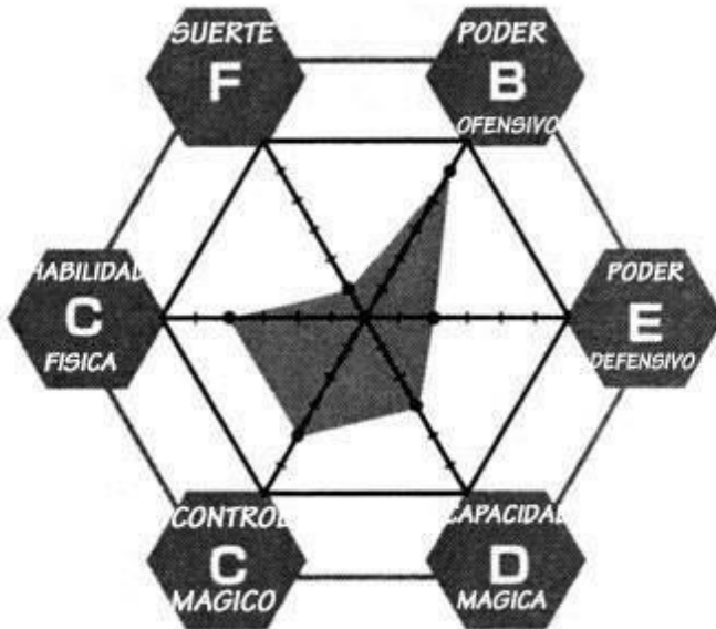
GRÁFICO DE ATRIBUTOS:

RESUMEN PERSONAL: INSTRUCTORA DE LA ACADEMIA HAGUN