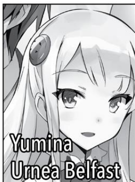
Yumina Urnea Belfast

One of Touya's wives. The elder of the twin sisters saved by Touya some time ago. A ferocious melee fighter, she makes use of gauntlets in combat. Her personality is fairly to-the-point and blunt. She can make use of Null fortification magic, specifically the spell [Boost] . She loves spicy foods.