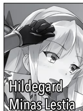
Hildegard Minas Lestia

One of Touya's wives. Former Clan Matriarch of the Fairies, she now serves as Brunhild's Court Magician. She claims to be six-hundred-and-twelve years old, but looks tremendously young. She can wield every magical element except Darkness, meaning her magical proficiency is that of a genius. Leen is a bit of a light-hearted bully.