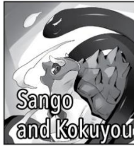
Sango and Kokuyou

The third of Touya's summoned Heavenly Beasts. She is the Flame Monarch, ruler of feathered things. Though her appearance is flashy and extravagant, she's actually quite cool and collected.