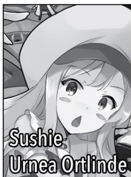
Sushie Urnea Ortlinde

A highschooler who was accidentally murdered by God. He's a no-hassle kind of guy who likes to go with the flow. He's not very good at reading the atmosphere, and typically makes rash decisions that bite him in the ass. His mana pool is limitless, he can flawlessly make use of every magical element, and he can cast any Null spell that he wants. He's currently the Grand Duke of Brunhild.