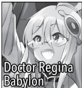
Doctor Regina Babylon

Terminal Gynoid in charge of the Alchemy Lab, one of the Babylon relics. She's called Flora for short and wears a nurse outfit. Her Airframe Serial Number is #21. A nurse with dangerously big boobs and even more dangerous medicines.