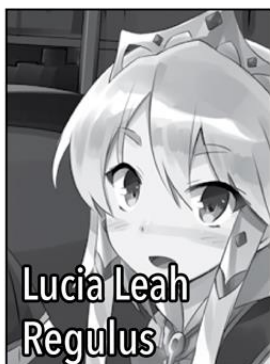
Lucia Leah Regulus

One of Touya's wives. She was ten years old in her initial appearance. Her nickname is Sue. The niece of Belfast's king, and Yumina's cousin. Touya saved her from being attacked on the road. She has an innocently adventurous spirit.