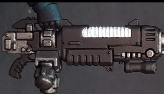
White in the coil Blanco en la bobina