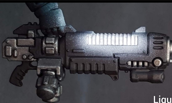
Liquitex white ink Aiming the coil Tinta blanca liquitex apuntando a la bobina