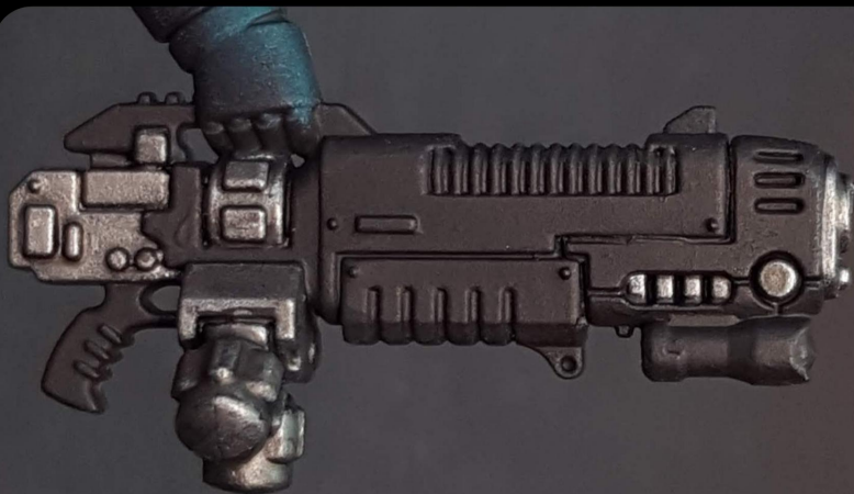
Ak Gun Metal