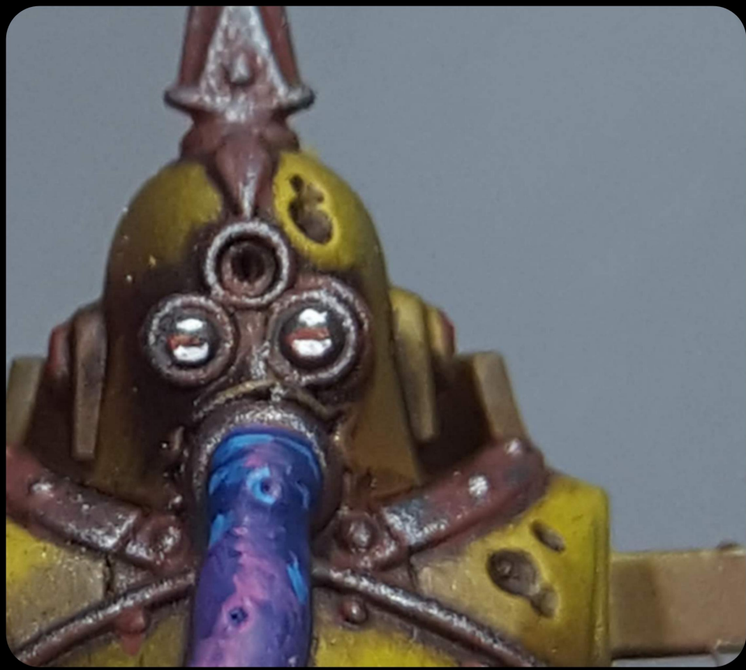
Eye detail Detalles de ojos