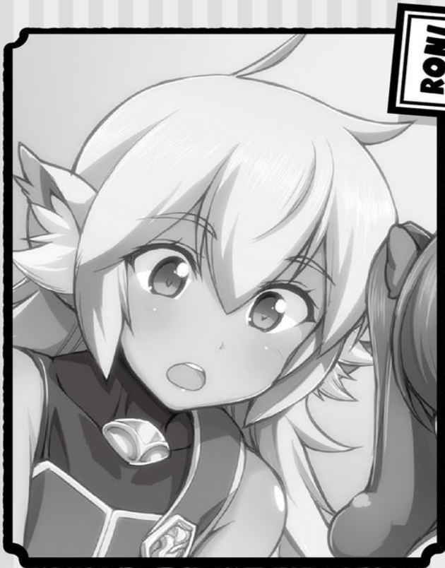
LA ASISTENTE DE CLENA. UNA LICAONA, UN LOBO SEMIHUMANO.