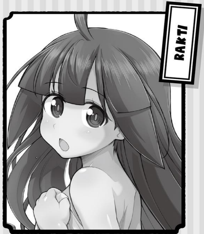
LA DIOSA DE LA OSCURIDAD. LA MÁS JOVEN DE LAS SEIS HERMANAS DIOSAS.