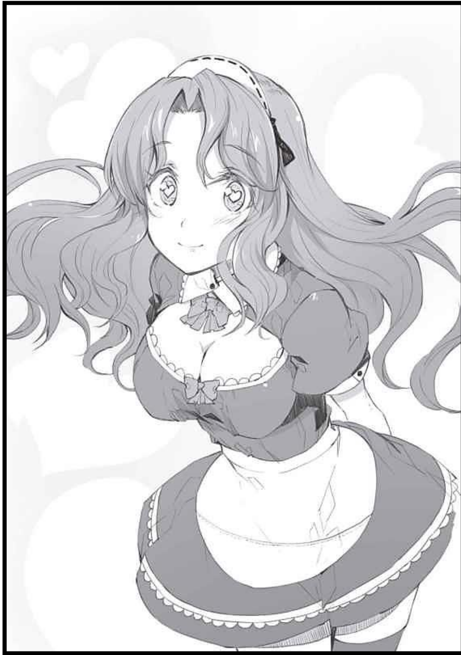
ILUSTRACIÓN (Zukulenta :v)